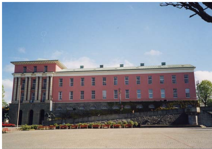
Figur 5.1: Haugesund rådhus

monumentale byggverket vart gitt i gåve av ein reiarlagsfamilie. Rådhuset står for noko meir enn berre eit byggverk, det representerer denne perioden i Haugesund si historie prega av skipsfart som byen er så stolt over. Når informantar trekkjer fram rådhuset når dei blir bedt om å skildre Haugesund, er dette òg å trekkje fram det maritime og alt det har gjort med byen. Måten informantane snakkar om kystidentiteten på vitnar om at det maritime er i ei særstilling i deira opplevingar av byen. Dette gjer det maritime til eit viktig aspekt i konstruksjonen av Haugesund som ein meningsfull stad.