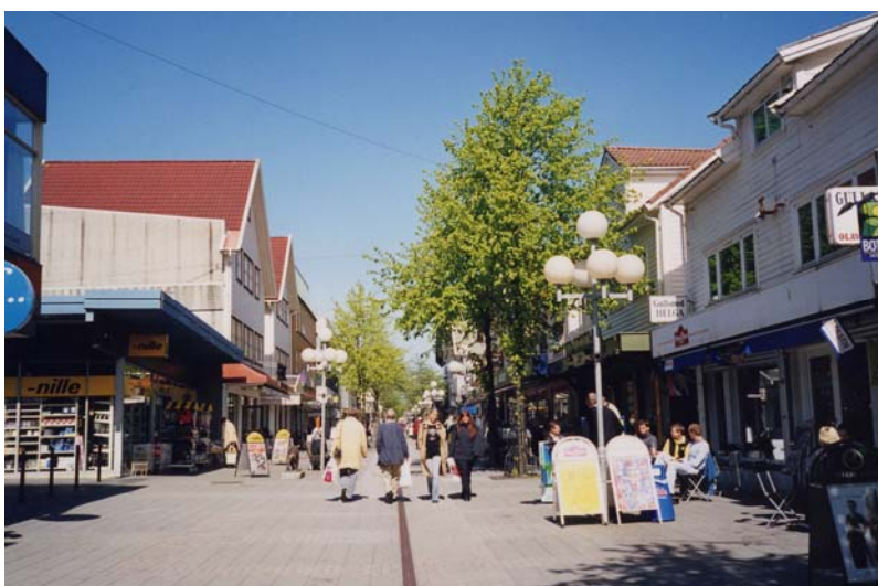
Figur 7.1: Haraldsgata

seg sjølv som dei korrekte brukarane med dei rette praksisane. Dette blir sett i kontrast til måten asylsøklarane og flyktningane bruker gågata på. Skildringar av gjengdanningar og kriminalitet går att når informantane fortel om korleis asylsøklarane og flyktningane ter seg i sentrum. Gjennom gågata understrekast todelinga mellom Oss som er "in place", og dei Andre som er "out of place". Det er lokalbefolkninga sine praksisar som samsvarer med det tatt-for-gitte meiningsaspektet ved gata. Dei Andre sine praksisar bryt med innbyggjarane sitt bilete av korleis gata skal brukast. Slik er geografien (Haraldsgata) eit verkty i definerings av kva som er "common sense" ved ein stad, og kven som er innanfor eller utanfor det lokale fellesskapet.