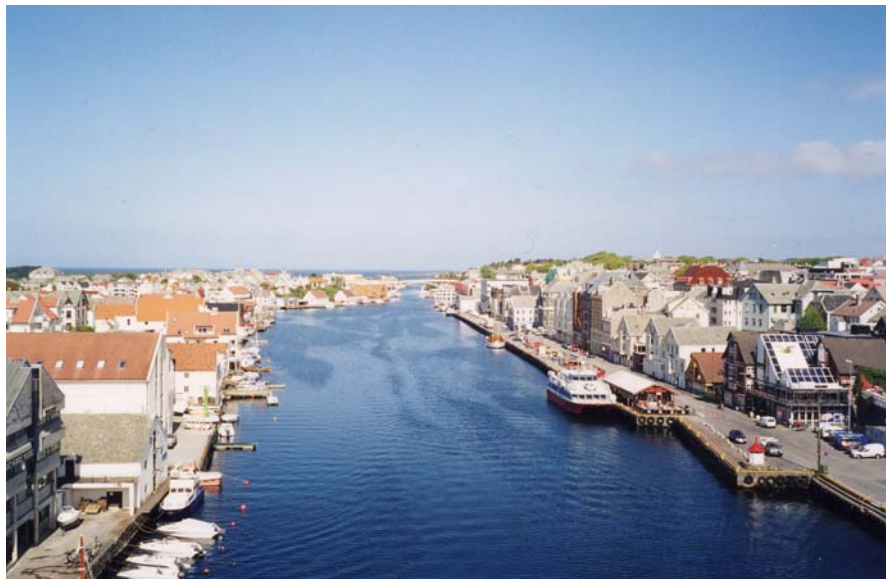
Figur 4.3: Hamna og Smedasundet i sentrum av Haugesund

tilsette. Dei maritime næringane, samt offshorenæringa, er likevel ikkje lenger dei einaste næringane som pregar Haugesund. Handel, samt offentleg og privat tenesteyting er i dag viktig for området. Haugesund sitt handelssenter har på landsbasis den høgaste omsetnaden per innbyggjar. Dette heng saman med at byen er regionsenter for Haugalandet som har omkring 150 000 innbyggjarar (Haugesund kommune, 2004). I tillegg til dette kan det nemnast at byen er vertskap for fleire festivalar av ulike slag, der jazz- og filmfestivalen er av dei mest kjente.