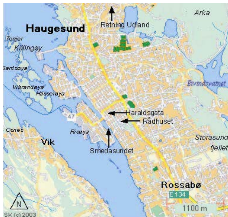
Figur 4.2: Haugesund sentrum.

kring er mykje av handelsstanden lokalisert. Dei siste åra har det òg blitt bygd fleire store kjøpesenter nokre kilometer utanfor sentrumsområdet. Ettersom byen ligg ved kysten er hamna og Smedasundet sentrale element i bybiletet (Figur 4.3).