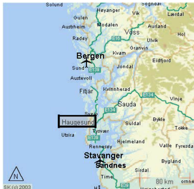
Figur 4.1: Området kring Haugesund.

Haugesund ligg nord i Rogaland fylke og er sentrum for distriktet mellom Hardangerfjorden i nord og Boknafjorden i sør (Figur 4.1). Kommunen er 72 km 2 stor, og hadde ved utgangen av år 2001 30 737 innbyggjarar 5 .