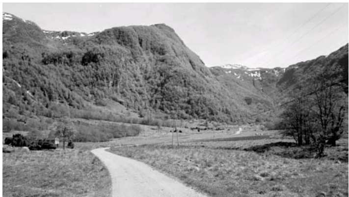
Muradalen sett innover rett ovenfor Hattebergfossen.

I 1920 kom et kraftverk innerst i Muradalen i drift, drøye to kilometer oppstrøms, og ikke synlig fra Baroniet eller Hattebergfossen. Verket utnyttet bare en del av fallet fra Prestavatnet til Murabotten, og var tenkt som en midlertidig ordning til det ble bygget et større, slik det var åpnet for i og med ervervelsen av fallrettene.