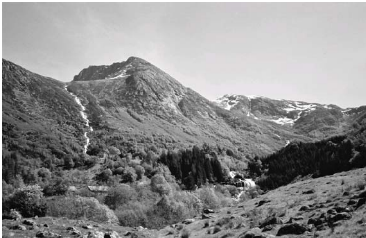
Sett innover mot Muradalen med Hattebergfossen til høyre i bildet.

meste beiting) og spor av tidligere masseuttak og industri (båtbygging). At dalen ikke er spesielt verneverdig, er et syn som deles av mange, også folk som ellers er motstandere av kraftutbygging og vil ha nasjonalpark. Selv fra dem som jobber opp mot mulig vern av dalen, som landskapsvern-