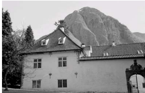
Utsnitt av slottet med Malmangernuten i bakgrunnen.

Bakgrunnen for Baroniet Rosendal, er et giftemål mellom Karen Mowat, enearving til farens, Axel Mowats, store gods, og Ludvig Rosenkrantz, dansk adelsmann. 20 De adelige setegårdene Hatteberg, Seim og Mel, ble gitt i medgift, og slottet reist på Hatteberg i 1660-årene. Etter Axel Mowats død i 1661, satt Ludvig Rosenkrantz igjen som en av Norges rikeste menn med enorme landområder. Deler av dette ble adlet i 1678, som ledd i Kongens ønske om å sikre seg en kongetro adel. Rosendal ble ved dette Norges første og eneste baroni. Som et eget len med alle friherrerettigheter , var det i praksis en stat i staten. Baroneren hadde ansvar for jurisdiksjonen, og kunne utnevne egne dommere med høyesterett som direkte ankeinstans. Han kunne skrive ut og innkassere bøter, og utnevne prester. I tillegg disponerte han over landmilitær innrullering, og hadde ansvar for veiene i lenet. I den grad noen følte at Baroneren misbrakte sin stilling var det mulig å klage til kongen. Dette var ressurskrevende, og så vidt jeg vet ble det bare gjort en gang, da gikk utfallet i Baronens favør. Friherrerettene fulgte godset frem til 1821 da de ble kraftig innskrenket ved lov.