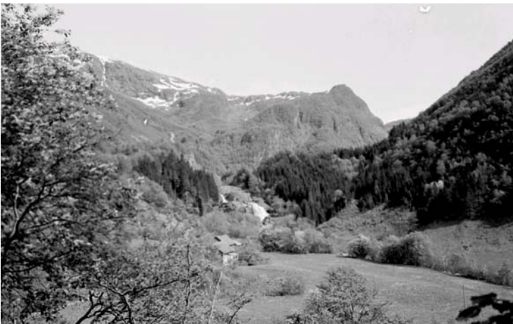
Hattebergfossen sett fra utsiktspunkt i parken.

Hattebergfossen og Baroniet er uten tvil sentrale elementer i landskapet som ønskes vernet. Samtidig er de også to elementer som vil bli forholdsvis lite berørt, sett i forhold til Ringeriksfossen og Murabotten. Slik jeg tolker det er det graden av berørthet som ligger