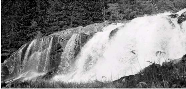
Tett på Hattebergfossen.

Utgangspunktet er også alltid at energiselskapet utelukkende vil drive med økonomiske mål for øye. Det er ikke mange av motstanderne som tar energiselskapets ikke-reglementsfastsette-løfter om hensynsfull drift alvorlig. Selvfølgelig er