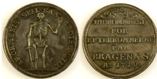
Fig. 9 Likbærerlaugets sølvmedalje 1719. Aversen fremstiller et 'memento mori': Af ormenis spil saa redes du til".