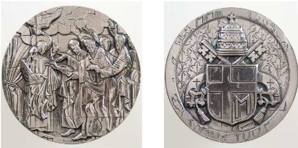
Fig. 12 Floriano Bodini, Italia: Jesus spottes, motiv fra Vatikanets serie av rosenkransmedaljer, her "de smertefylte mysteriene". 2003. Støpt sølvmedalje, diam. 40 mm., vekt 45 gr. Innkjøpt til samlingen i 2003.

Tilvekster var det altså ikke mange av i siste halvdel av det 20. århundre – bare Den kongelige Mynt, siden 2003 'Det norske myntverket', har vært en trofast årlig giver. De siste større tilvekster var foræringen i 1956 av i alt 160 kinesiske mynter, i 1958 av en samling på 25 utstillingsmedaljer fra det 19. århundre, og meteorologen Vilhelm Bjerknes' medaljer og ordenstegn, i alt ca. 40 stykker, som ble gitt til Bergen Museum i 2001. 43 Med denne siste fornemme donasjonen kunne man nesten tale om et vendepunkt. Som vi skal se, ble medaljer i 2003 et satsingsområde, og i den forbindelse var det naturlig igjen å forsøke å sikre medaljesamlingen en viss tilvekst. Således ble en serie sølvmedaljer med Rosenkransens mysterier, i alt 21 stykker, utgitt av Vatikanet i 2003 allerede samme år ervervet til museet (Fig. 12).