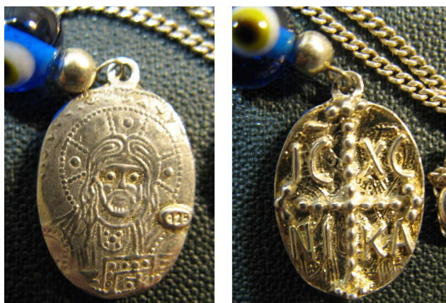
Fig. 15 Liten gresk medalje i sølv, kjøpt til samlingen på Samos i 2007.