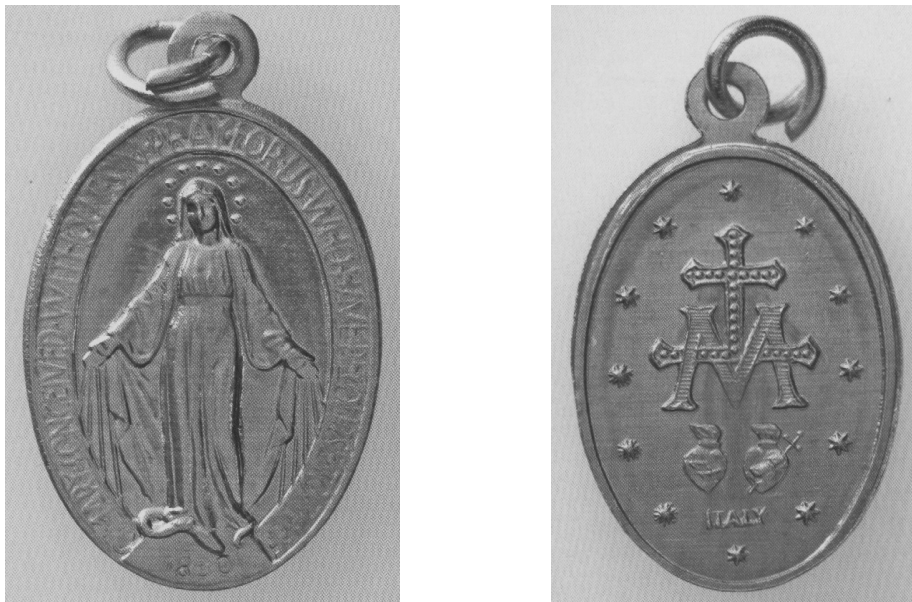
Fig. 19 Den undergjørende Maria-medalje fra 1830, masseprodusert eksemplar fra det 20. århundre, utført i aluminium, oval, 20 x 15 mm. Aversen viser Jomfru Maria, aversen hennes monogram over Jesu og Marias hjerter. Anskaffet til samlingen i 2004.