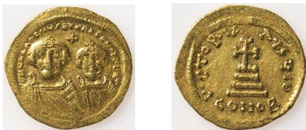
Fig. 11 En solidus, gullmynt preget omkring 615 under kong Herakleios av Bysants. Diam.ca. 20 mm. Aversen viser kongens og hans sønn, mens reversen har en fremstilling av det hellige kors.