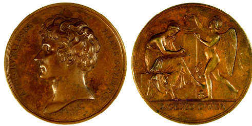
Fig. 2 Bronsemedalje for Bertel Thorvaldsen, 1817.