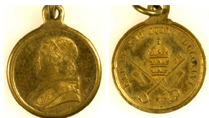
Fig. 4 Liten bronsemedalje av Pius IX fra 1846, 14 mm. diam., vekt 1 gr., innkommet 1849.

Det var også tydelig at man ikke bare interesserte seg for historiske gjenstander, men også fikk inn samtidig materiale. For eksempel mottok man i 1829 en helt ny medalje, slått i anledning av den såkalte greske frihetskrigen mellom Russland og Tyrkia, 1828-29. Eller i 1849 en medalje slått i anledningen av Pius IXs valg som pave tre år tidligere. 18 (Fig. 4) Senere skulle en jevn strøm av samtidige medaljer tilflyte samlingen, for eksempel de 40 nye franske medaljer som konsul Børs ga i 1899.