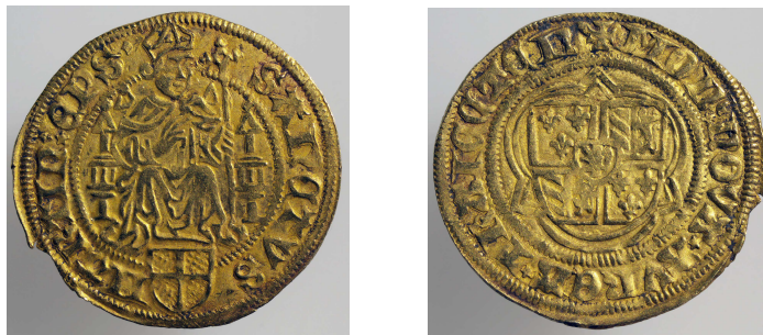
Fig. 10 En nederlandsk gylden, preget av biskop David av Utrecht (1457-96), diam. 23 mm. Mynten stammer fra et funn på Bergenhus av 63 slike gullmynter; en skatt lagt i en liten krukke som ble gravd ned omkring 1490. Forsiden, aversen, har en fremstilling av den hellige biskop Martin av Tours, mens baksiden, reversen, viser biskopens våpenskjold. Innkommet i 1900.

de hundre moderne medaljer, den yngste fra 1899. 35 Et annen vesentlig tilvekst kom så i tillegg med overlærer N. Th. Wallems testamentariske gave i 1908 på omtrent 700 mynter og medaljer. 36 I museets årsberetning for 1911 ble det opplyst at samlingen av mynter, medaljer og sedler omfattet i alt 12275 eksemplarer. Året etter opplyses det at samlingen av medaljer utgjorde 934 stykker, mens den fornemste del av seddelsamlingen var 175 gamle dansk-norske sedler. 37 Ut fra de tallene vi har omfattet samlingen omkring 1910 nesten 15.000 mynter og medaljer.