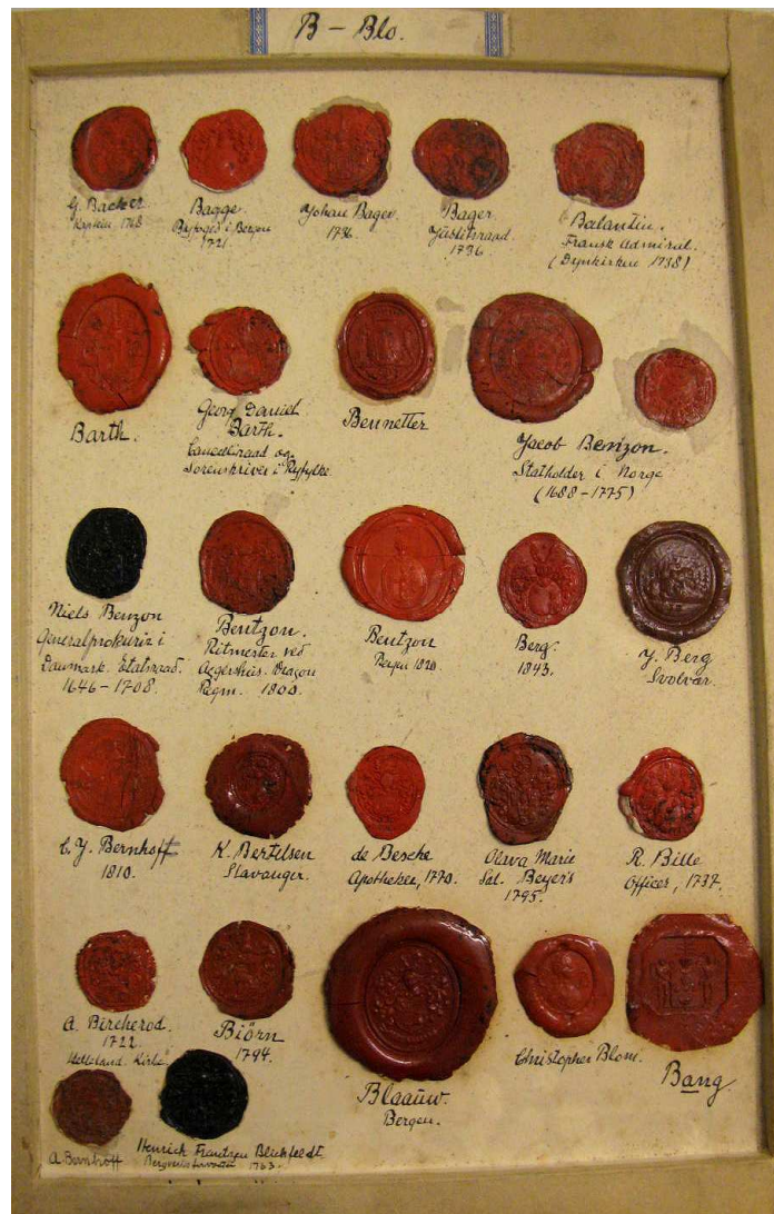
Fig. 5 En bakke fra den Grundtvigske seglsamling. Privatvåpen, 'B-Blo', med 27 lakksegl. Øverst til venstre, våpenet for familien Backer, Christiania 1768, og til sist et udatert lakksegl for en Christopher Blom.

omtrent 7000 originale heraldiske lakksegl fra siste halvdel av 1600-årene og frem til et stykke inn på 1800-tallet.