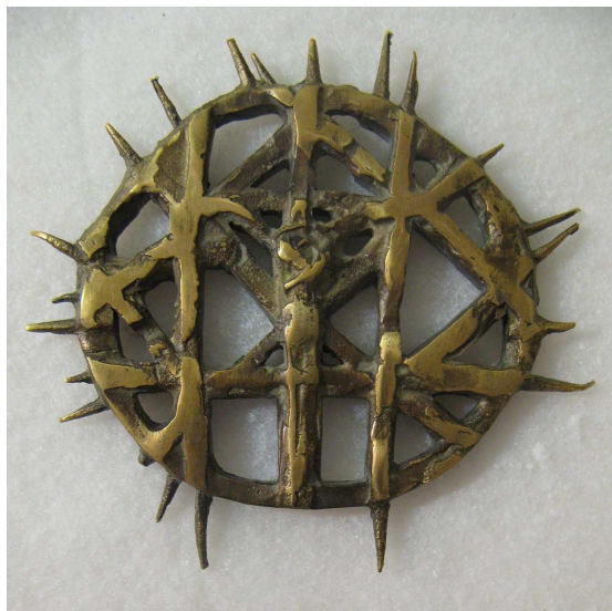
Fig. 21 Teodora Draganova: Ensidig medalje i messing: 'Thorny Wreath I', utført i 2003. Den måler 105 x 102 mm. og veier 174 gr. Kjøpt til museet i 2006.

Ved ”innsamling” menes i dag naturligvis i praksis ”innkjøp”. Nettopp når det gjelder forutsetningene for en meningsfylt supplering av medaljesamlingen, er en viss økonomi av betydning. I så måte, kan vi også i 2008 uten problemer underskrive hjertesukket fra museets årsmelding 1896, der man konstaterte at myntkabinettet savnet penger til systematisk innkjøp. ”I en samlings begyndelse gaar det an, at nøie sig med, hva der tilbydes, men naar den er vokset til en vis betydning, er dette ikke længer tilstrækkeligt. Det er nødvendig ved planmæssige indkjøb efterhvert at gjøre samlingen virkelig repræsentativ”. 92