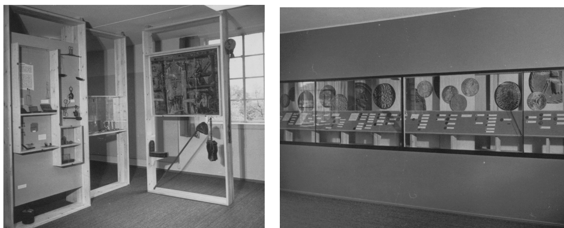
Fig. 17 Fra utstillingen "Iuno Moneta – betalingsmidler gjennom tidene" på Historisk museum 1963.

1964-65 stengte utstillingen av mynter og medaljer i det som nå het Historisk museum. Siden da, altså i nå vel 40 år, har det ikke vært noen utstilling av mynter og medaljer på Bergen Museum.