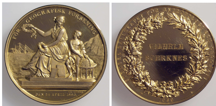
Fig. 7 Det "Svenska sällskapet för antropologi och geografi"s gullmedalje, på 92,5 gr. rent gull, gitt til Vilhelm Bjerknes i 1939. Diam. 56 mm.

Selv i perioder der det knapt ble arbeidet med samlingene opphørte virksomheten aldri helt. I slutningen av august 1866 skrev Schive for eksempel til museet og gjorde oppmerksom på at det omtrent en kilometer utenfor Stavanger var gjort et betydelig funn av mynter fra 900-årene, og han mente at museet burde sikre seg dette – hvilket antikvarisk avdelings styre da også straks besluttet seg til. 26 Om arbeidet med myntsamlingen i stadig mindre omfang utgjorde de ansattes hovedinnsats, kom det dog jevnlig inn nye mynter og medaljer til museet.