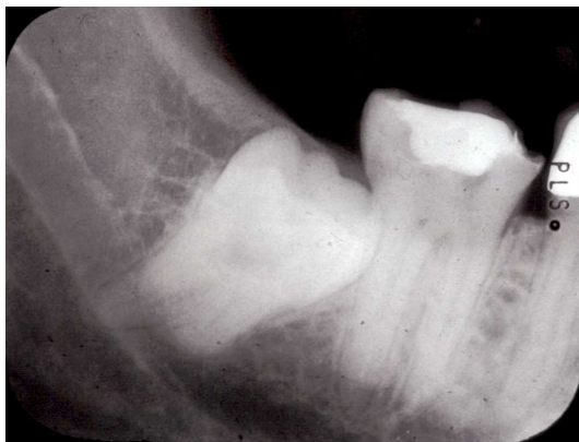
Impaktert og retinert visdomstann 48 (t. v)

Materialet inneholder klart flest partielt erupterte visdomstener (74). NS.