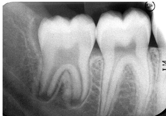
Partielt eruptert visdomstann 48