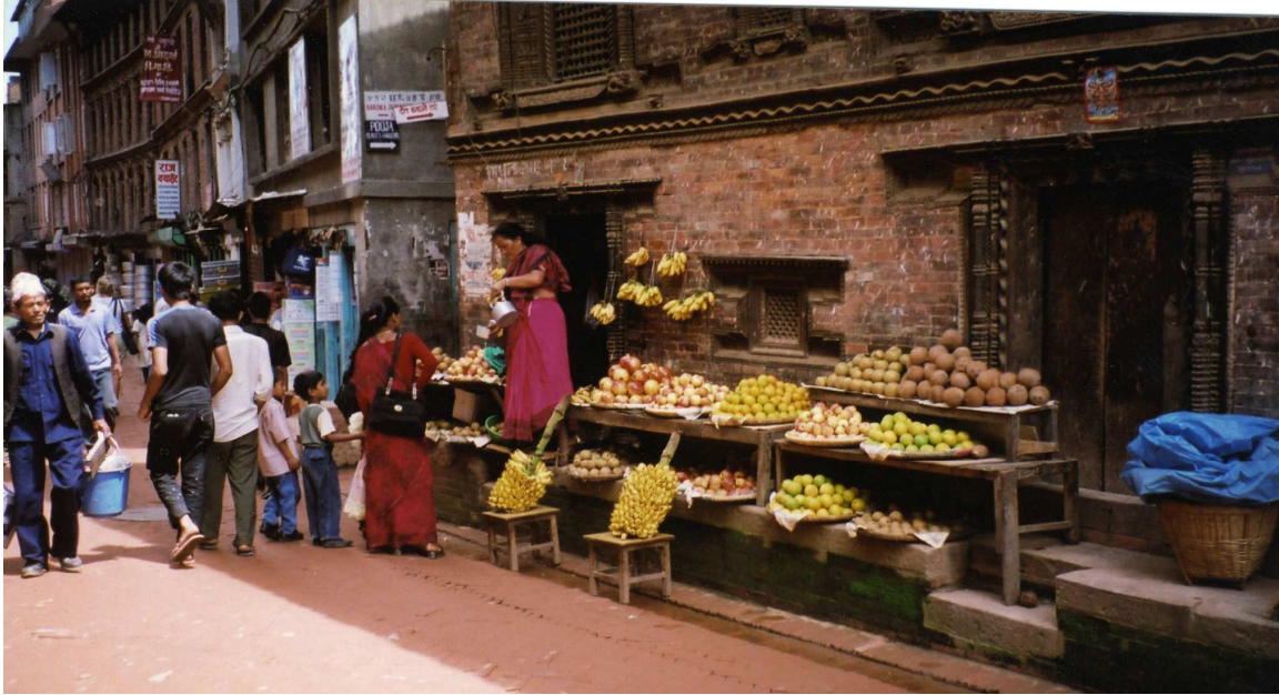
Foto 1: Et tradisjonelt newar hus med butikk langs hovedgaten i øvre del av byen. Gaten er brolagt med teglstein.

Bhaktapur har vokst fram gjennom en tilpassing til tidligere bebyggelse og til topografiske begrensninger. Jeg kaller Bhaktapur en by, men det er vel mer korrekt å kalle den en samling forvokste landsbyer. Nærmere 85% av innbyggerne driver jordbruk og sammen med de øvrige yrkesgruppene bor de i en tett klynge med jordene i en krans rundt bebyggelsen. På mange måter minner den fysiske utformingen av boligbebyggelsen om norske klyngetun. Hver av "landsbyene" har en åpen plass kalt twa på newari (tol på nepali).