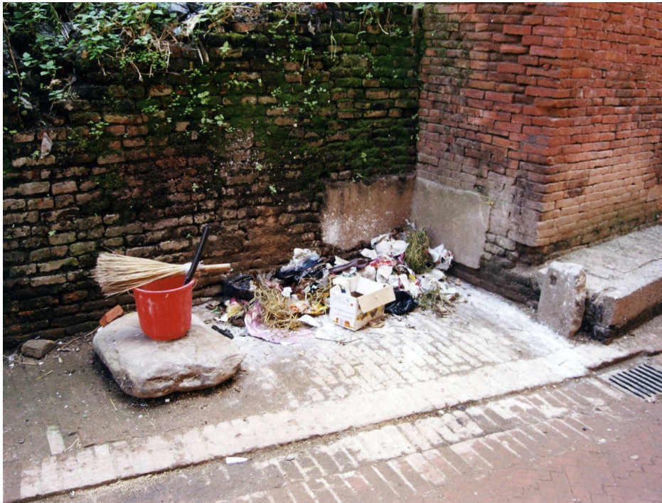
Foto 9: Oppsamlingsplass for husholdningsavfall. Legg merke til kalking.

kalk (calciumoxid), på droppstedene for søppel (foto 9) både for å hindre bakteriespredning og for å markere at søppelet var hentet den dagen. Dessuten, la de til med et smil om munnen, "forhindrer det barna i å urinere i krokene fordi mødrene tror stoffet er skadelig." Stoffet er farlig. Lesket kalk virker irriterende på øyne, luftveier og hud og er etsende ved tilsetning av vann. Lesket kalk hever pH og er desinfiserende (Frantzfoss Miljøkalk 2005). I små mengder vil kalk forbedre jordkvaliteten. Forsøk viser at kalk tilsetning i kompost vil føre til jevnere og høyere temperaturøkning noe som gir bedre kompostering (Aasen 2005). Kalken er spredd ut etter at avfallet er fjernet, men vil blandes i neste ladning med søppel. På den måten er det mulig denne praksisen kan hjelpe i komposteringen, men det ville vært mer effektivt å tilsette den direkte på kompostanlegget i stedet for indirekte i gatene. Jeg tror derfor ikke dette er bakgrunn for denne praksis. Som markør for at søppelet er innsamlet er kalk effektiv og for en uvitende person gir også hvit kalk et inntrykk av renslighet.