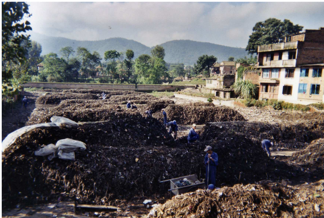
Foto 10: Bhaktapur Compost Plant (BCP). Arbeid med å vende radene og å plukke ut ikke-komposterbart materiale. Beboerne i nabohusene er Pore .

I følge Tuladhar & Bania (1997) beregninger skal 6 mann kunne produsere 1,8 tonn kompost pr. dag i drift, mens det faktisk ble produsert ca 1 tonn kompost pr. dag med 6 arbeidere i 1997. Sanitation Sector oppgir at det pr. 2001 jobber 15 mann på komposteringsanlegget. Det vil si at BCP i følge overnevnte beregninger skulle kunne produsere 4,5 tonn kompost daglig i 2001, men kanskje bare produserte 2,5 tonn. Et overslag av pris og tonn kompost solgt tyder på at anlegget produserer enda mindre enn 2,5 tonn eventuelt at ikke alt salg er oppgitt i kommunens regnskaper (Tuladhar & Bania 1997). Det er tydelig at anlegget ikke utnyttes maksimalt og noe av forklaringen kan ligge i manglende etterspørsel.