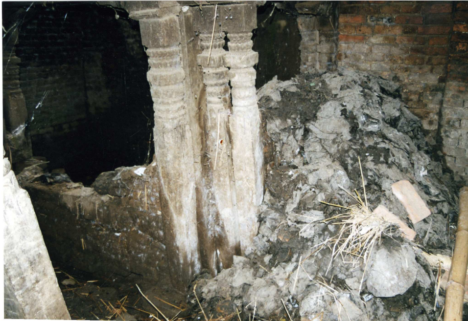
Foto 7: Kompostbinge i cheli under trapp opp til 2 etasje. Denne bingen er nettopp gravd ut slik at komposten ligger utenfor til høyre.