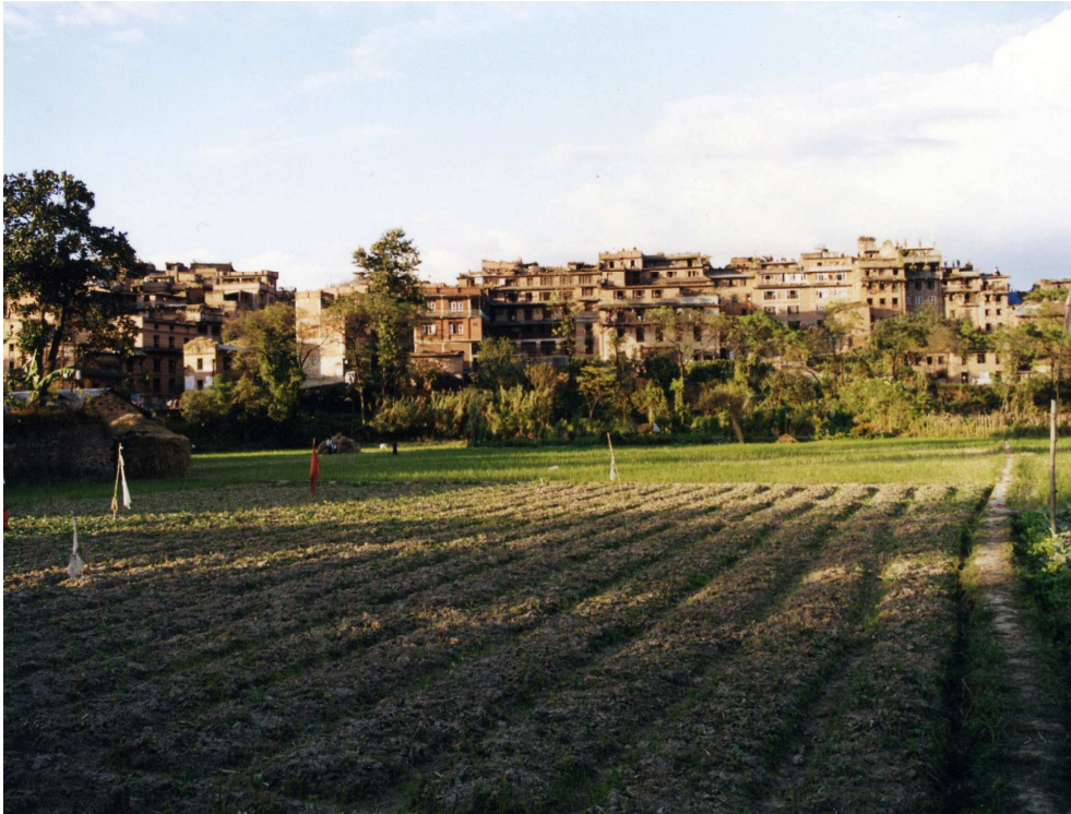
Foto 5: Bhaktapur er en tett landsby på en åsrygg, med jordene rundt. Det flate jordbruksområdet rundt byen kalles byasi og er en av Bhaktapurs grenser.