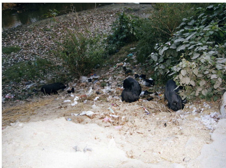
Foto 12: Sorte griser som roter etter mat i søpla med den gamle dumpingplassen.

Ved den gamle dumpingplassen i ward 11 observerte jeg griser som rotet i søpla etter mat (foto 12). Dette betyr at denne plassen fortsatt er i bruk. Sanitation Sector sier den er nedlagt, men der er så mye ferskt organisk materiale den må være i daglig og systematisk bruk. Det var for mye søppel til at kun noen hushold i nærheten brakte sitt søppel dit.