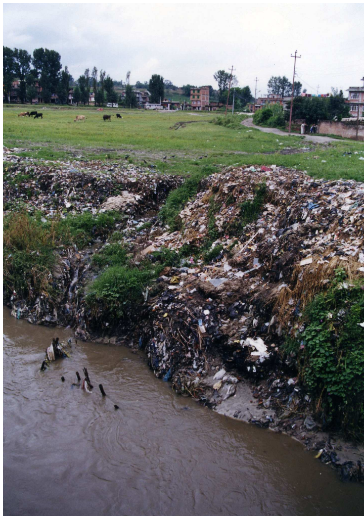
Foto 11: Søppeldeponiet ved Sallaghari med beitende kyr i bakgrunnen.

Andre i området sier de ikke ble spurt før kommunen begynte å bruke Sallaghari som dumpingplass. Enten de samtykte eller ikke føler folk i området seg lurt og har gjentatte ganger protestert ovenfor kommunen. De mener at fordi ordføreren ikke har svart på brevene deres er han mer opptatt av å holde Bhaktapur by ren for turistene enn å hjelpe dem med å bli kvitt søppelfyllinga og helseplagene. Personene jeg snakket med nevnte flue, mygg og luktplager. En kvinne inviterte sjelden folk hjem etter at søppelfyllingen kom rundt svingen fordi hun nå har så mye fluer i huset. Hun var flau og redd for hva folk måtte si om hennes renhold av huset. Da hun inviterte meg inn var det et tyvetalls store, svarte fluer som fulgte med inn. Andre beboere i område var mer bekymret for sykdom. De var plaget med kvalme, oppkast og diaré og mente søppelet hadde skylden. Patologiske bakterier fraktes ikke med vinden, men svermer av insekter samt fugler og små pattedyr på dumpingplassen kan bringe dem fra søppeldeponiet til husene rundt (Strand, pers.med.).