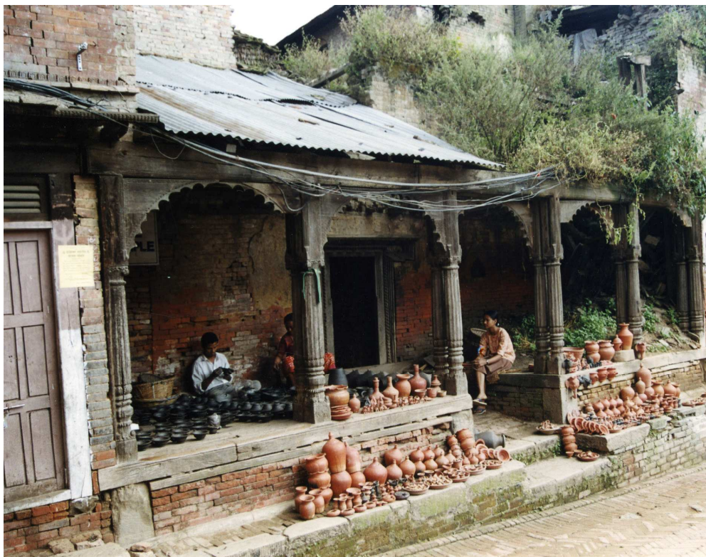
Foto 6: Palcha. Her er det brukt til både produksjon og salg av keramikk.