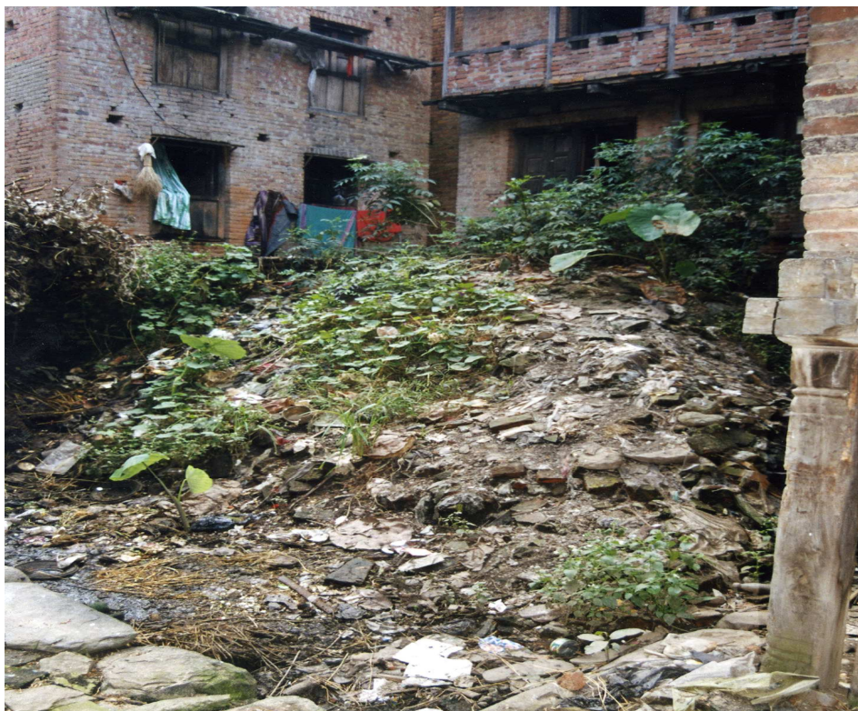
Foto 8: Komposthaug i bakgård. Haugen er anlagt i en åpning som oppstod der et tidligere hus kollapset og det er derfor stort innslag av teglstein.

Til daglig ble huset feiet fra nederste etasje og oppover (Lall 1976). Kjøkkenet var da som nå, i øverste etasje og støv fra feiing ble sammen med kjøkkenavfall og aske fra ovnen kastet ut