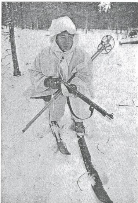
Finsk soldat på spaning under vinterkriget. Hur är han utrustad för att skydda sig mot upptäckt?