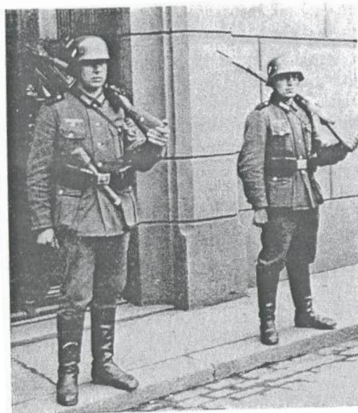
Norge är inte längre fritt. Tyska soldater står på vakt utanför dörren till stortingets samlingslokal i Oslo i april 1940. Det skulle dröja över fem år, innan stortinget åter kunde samlas till fria överläggningar.