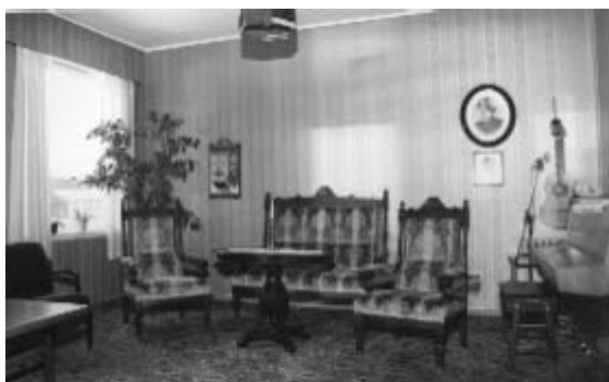
Finstua ca. 1960 66

Stedet har beholdt stua fra tuberkulosestiden med møbler fra tidligere pasienter. På dagsenteret har de tatt vare på en gammel symaskin og pusset opp stoler og skap fra sanatorietiden. Vefsn Museum har spytteflasker og blåseapparat fra Vefsn Sanatorium. I kjelleren finnes fortsatt barnebekken som tegn på at også barn har vært innlagt her.