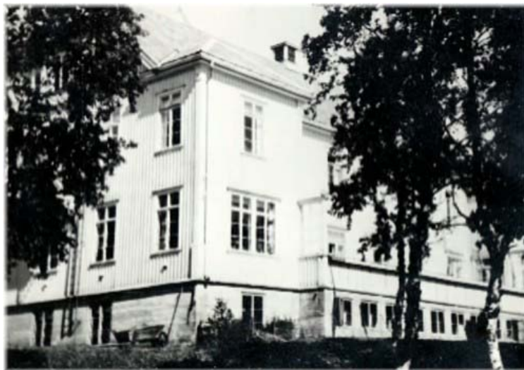
Gibostad Tuberkulosehjem 1928 55