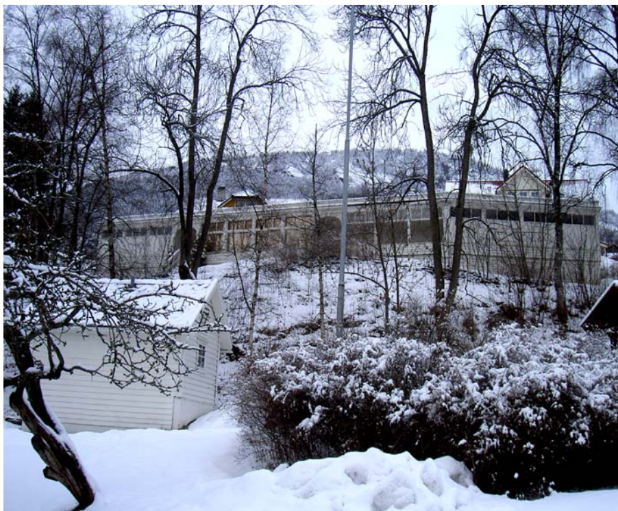
Kurhallen (2004) med en del av det tidligere kapellet foran.

sengene. Legens kontor er gjenskapt og innredet med både røntgenapparat og annet medisinsk utstyr.