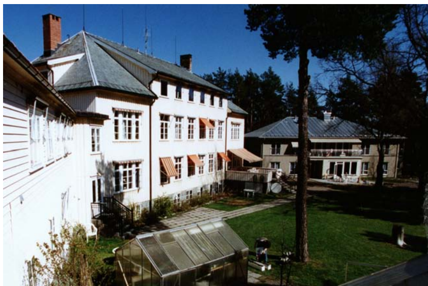
Søndre Vestfold DPS (ca. 1995) med ett av de to nybyggene til høyre 74

Etter en periode med psykiatriske langtidspasienter fikk stedet i 1989 navnet ”psykiatrisk senter”. Samtidig begynte planleggingen av flere bygningsmessige endringer. Den gamle hovedbygningen ble totalrenovert innvendig. To nye bygninger ble plassert på hver side av hovedbygningen. Resultatet ble omtalt som utradisjonelt i psykiatrisk behandlingssammenheng, sannsynligvis fordi utvidelsen besto av to atskilte enheter som gjorde det mulig å skille og differensiere ulike pasientgrupper. Nybyggene har to etasjer med fem pasienter i hver av etasjene. I sentrum av byggene er fellesarealer som kjøkken, oppholdsrom, kontorer og vaktrom. Under innvielsen av dette ”nye” stedet kan man lese om beliggenhet og ønske om holdningsendring: