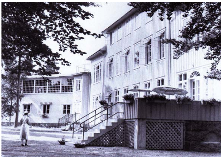
Preståsen Tuberkulosehjem, ca. 1935, med kurhallen til venstre 72