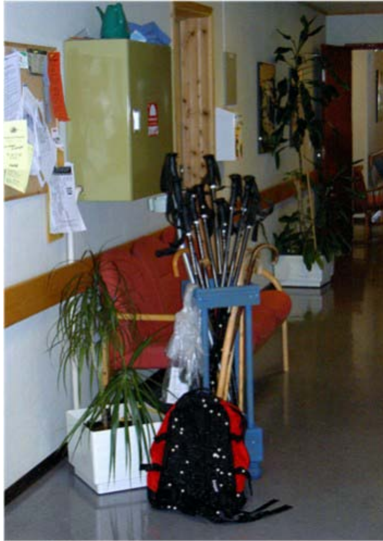
Gåstavene i denne institusjonen oppfordrer til turer i frisk luft

Fotografiet viser en korridor som er alt annet enn hjemlig. Kombinasjonen av skapet til brannslangen, oppslagstavla, potteplantene og turutstyret gir et noe kaotisk inntrykk, samtidig som gåstavenes og ryggsekkens dominerende plassering er en tydelig oppfordring til å bruke kroppen utendørs.