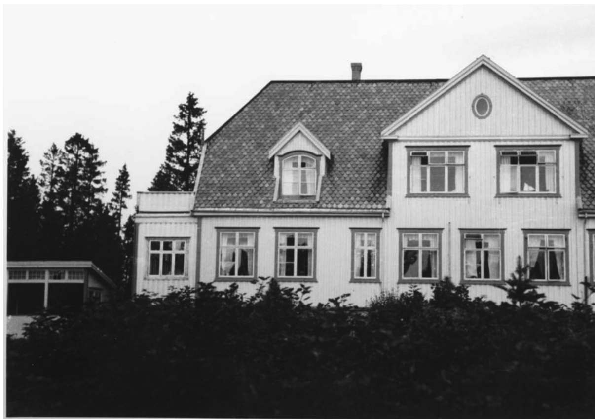
Vefsn Tuberkulosehjem, ca. 1918. Kurhallen til venstre 61