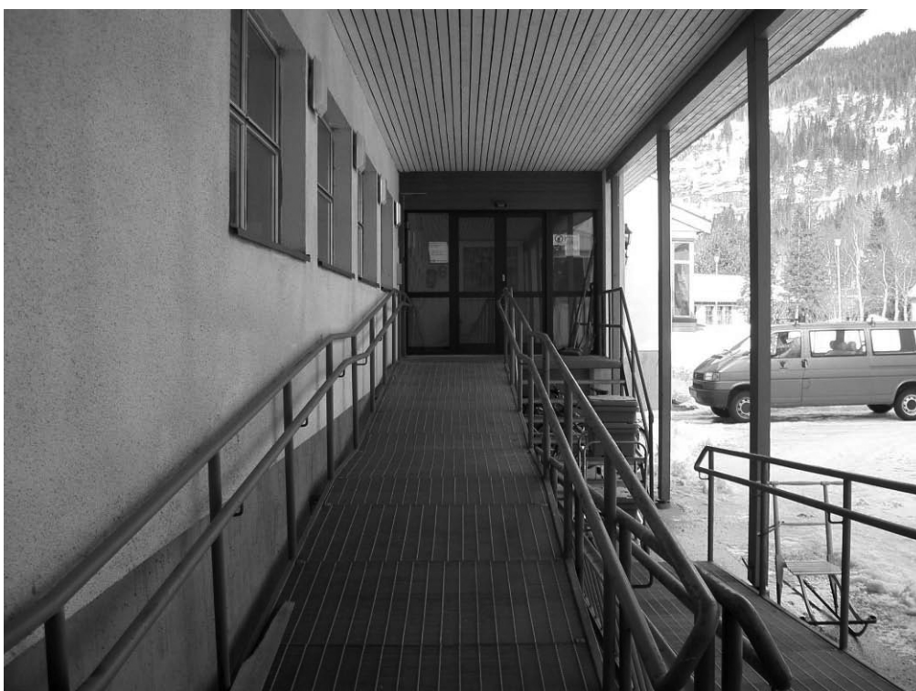
Inngangspartiet til døgnavdelingen 2004

Arkitektfirmaet M.N.A.L. Nils Toft tegnet et nytt tilbygg i 1989. I brev fra Fylkeslegen datert 6. mai 1983 til arkitektfirmaet sies det at det særlig er lagt vekt på at det må være en klar