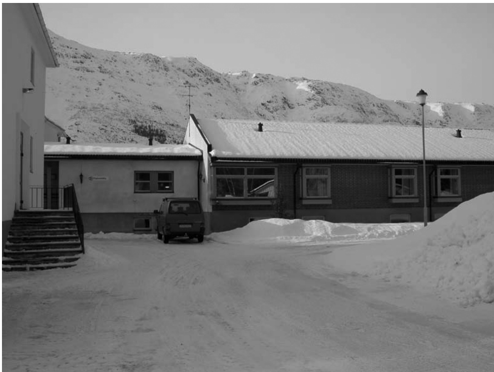
Tilbygget fra 1989 hvor døgnavdelingen er plassert