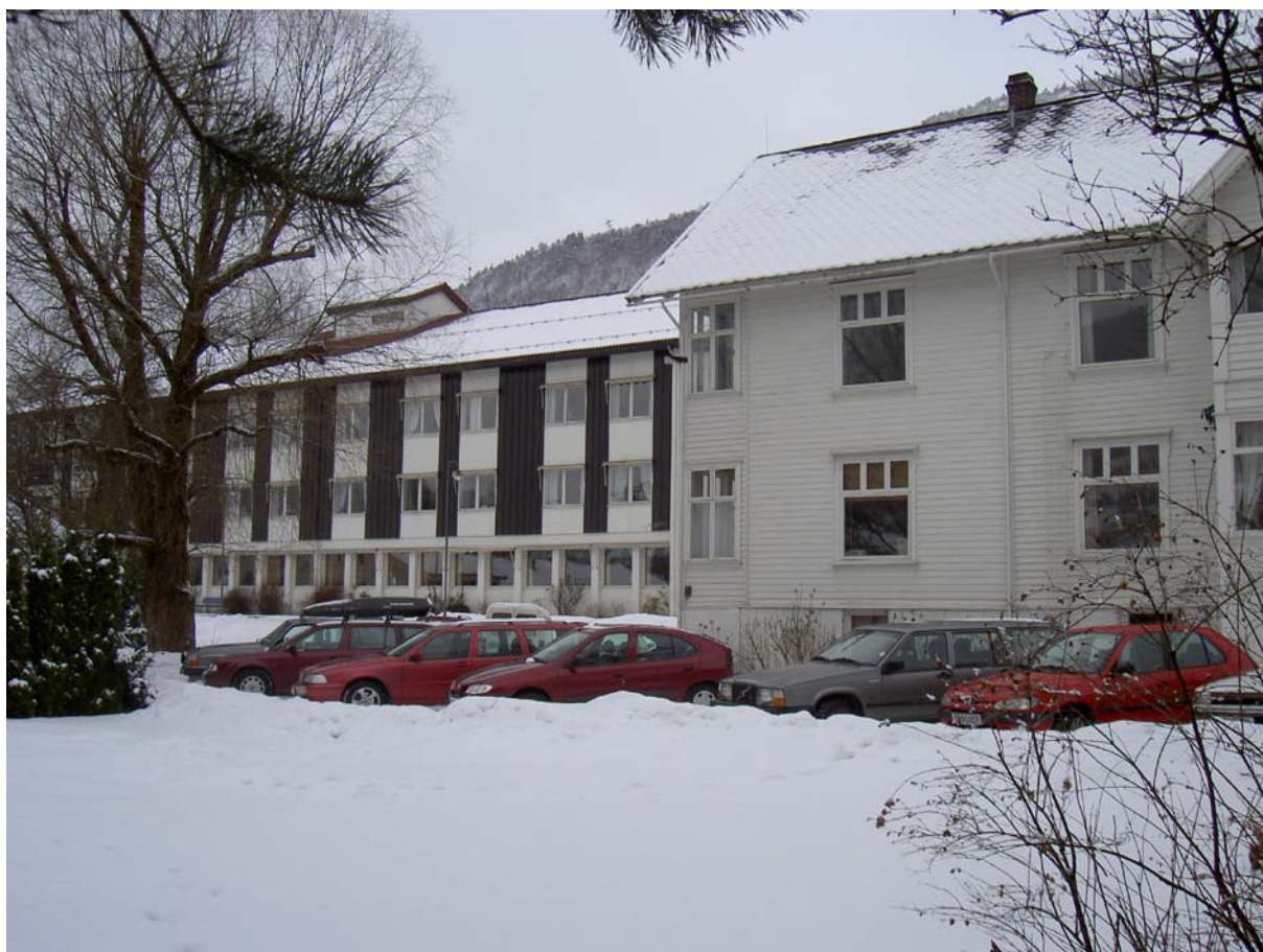
Bjørkeli Voss Psykiatriske senter, 2004

I jubileumsskriftet fra 1998 vises det til stedets endringsprosesser. Her finnes et dikt om et gammelt rom som lenge hadde stått tomt og nå var i ferd med å bli pusset opp. På den ene siden personifiseres rommet, på den andre siden viser diktet hvordan ansatte påvirker det bygde: