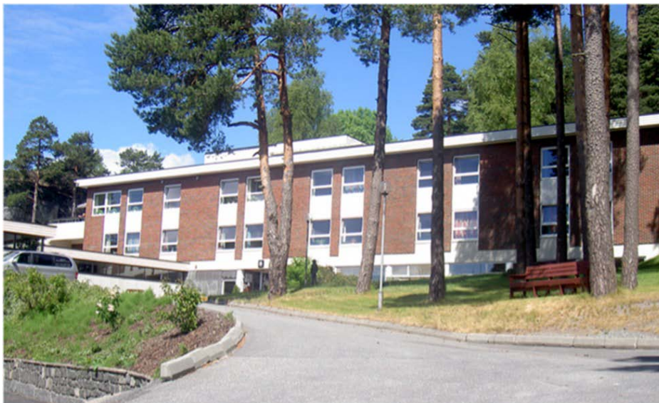
Nybygget fra 1974

I 2000 ble Furubakken innlemmet i Søndre Vestfold DPS, sammen med to andre distriktpsikiatriske sentra i fylket (blant annet Preståsen som ble omtalt i forrige kapittel), en del av Helseforetak Sør. Aktivitetsavdelingen ble nedlagt og aktivitetene overflyttet til