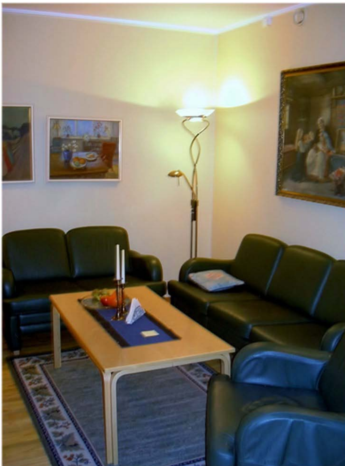
Fra dagligstua i en av døgnavdelingene.