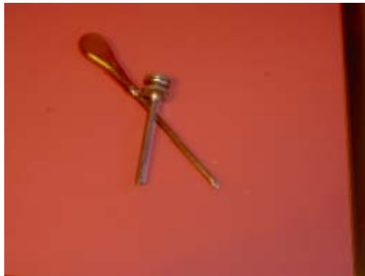
Lungepunkteringsnålen fra skuffen til vaktmesteren. Denne oppbevarte han sammen med skrujern og annet verktøy.

På loftet i dagens DPS finnes fortsatt minner fra tidligere tider: spyttekrus i stål, hjemmelaget undersøkelsesbenk i rød skai, blåseapparat og røntgenapparat. Vaktmesteren viste fram innrammede fotografier av de fem første tilsynslegene på stedet. I tillegg finnes en eske med 19 skilt hvor man kan lese navnene på de ulike foreningene som betalte for pasientsengene. Vaktmesteren viste meg også en nål til punktering av lunger: