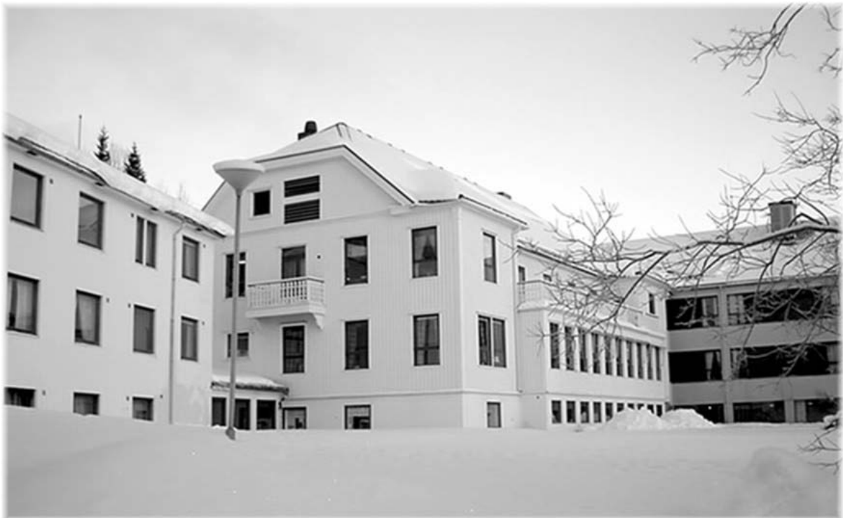
Senter for Psykisk Helse, avd. Gibostad 2004

Antallet døgnpasienter ble stadig redusert. Rundt 1990 hadde institusjonen 39 psykiatriske pasienter. I 2004 var her 12 døgnpasienter.