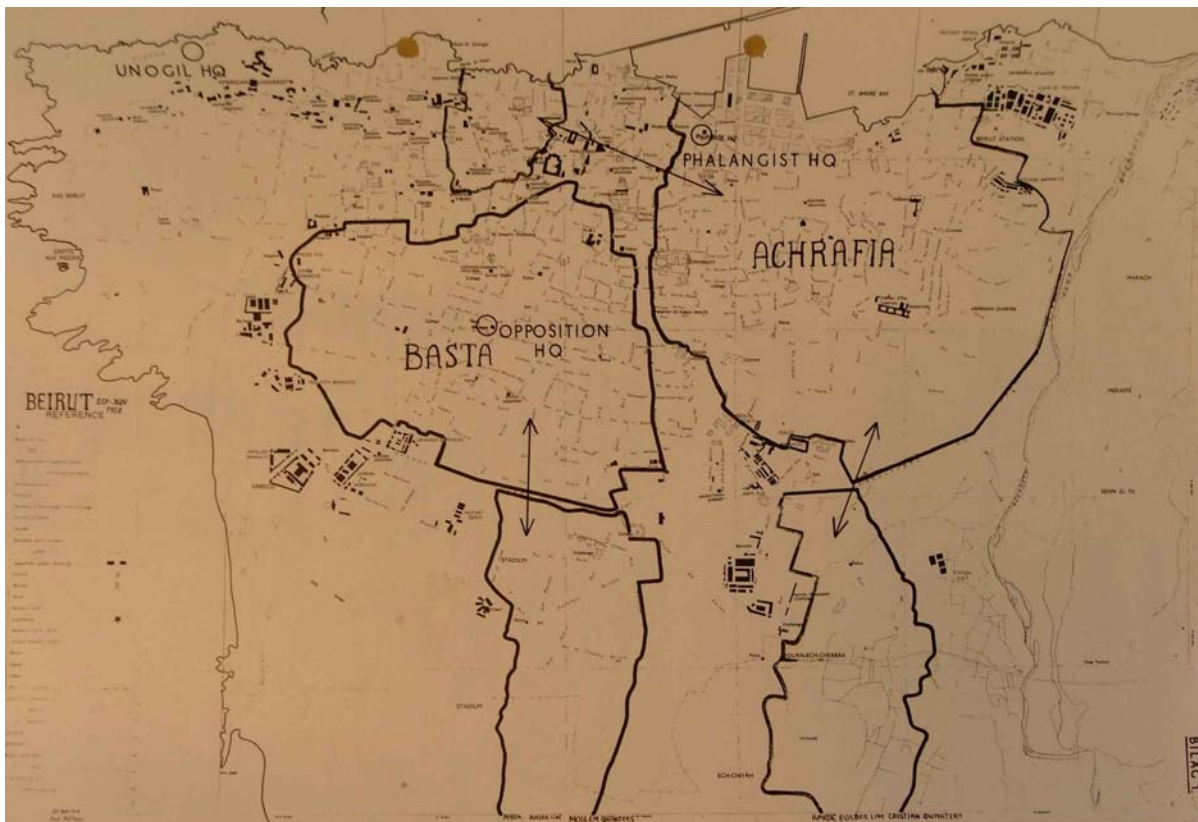
Vedlegg 1: Kart over Beirut, delt inn i sonar kontrollert av høvesvis opposisjonen og Falangistane. 534