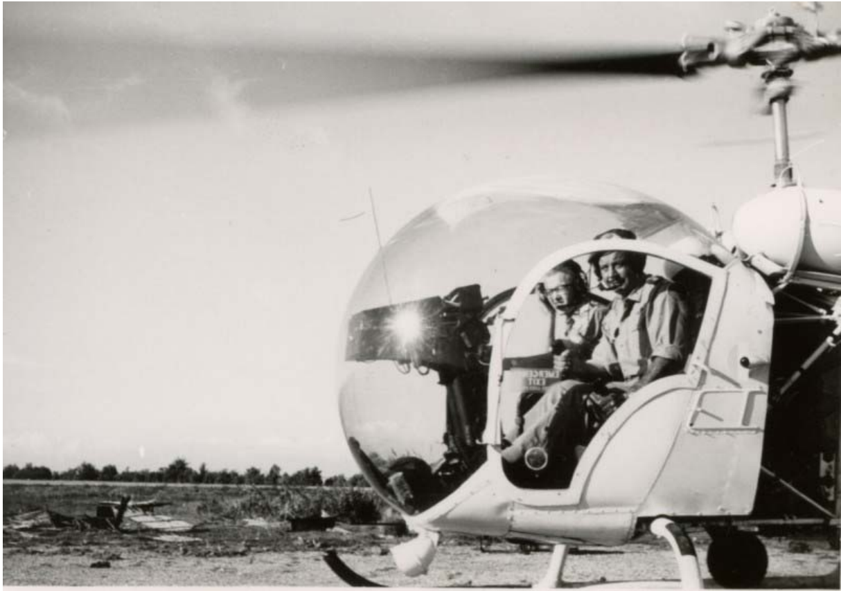
Bilete 3: FN-observatørar i eit Bell 47G-2 helikopter klar for avgang frå flyplassen i Beirut.

University Experimental Farm, Btedai, Saghbine og Rachaya), Marjayoun og Saida. 243 Målet var å skipa stasjonar eller sjekkpostar så nærme grensa som mogleg og langs kjende og potensielle ruter for smugling og infiltrasjon. Observatørane budde i desse utestasjonane som vart nytta som utgangspunkt for patruljering i omkringliggjande områder, sjekka innrapportert infiltrasjon og halda greie på mistenkelege rørsler eller utvikling.