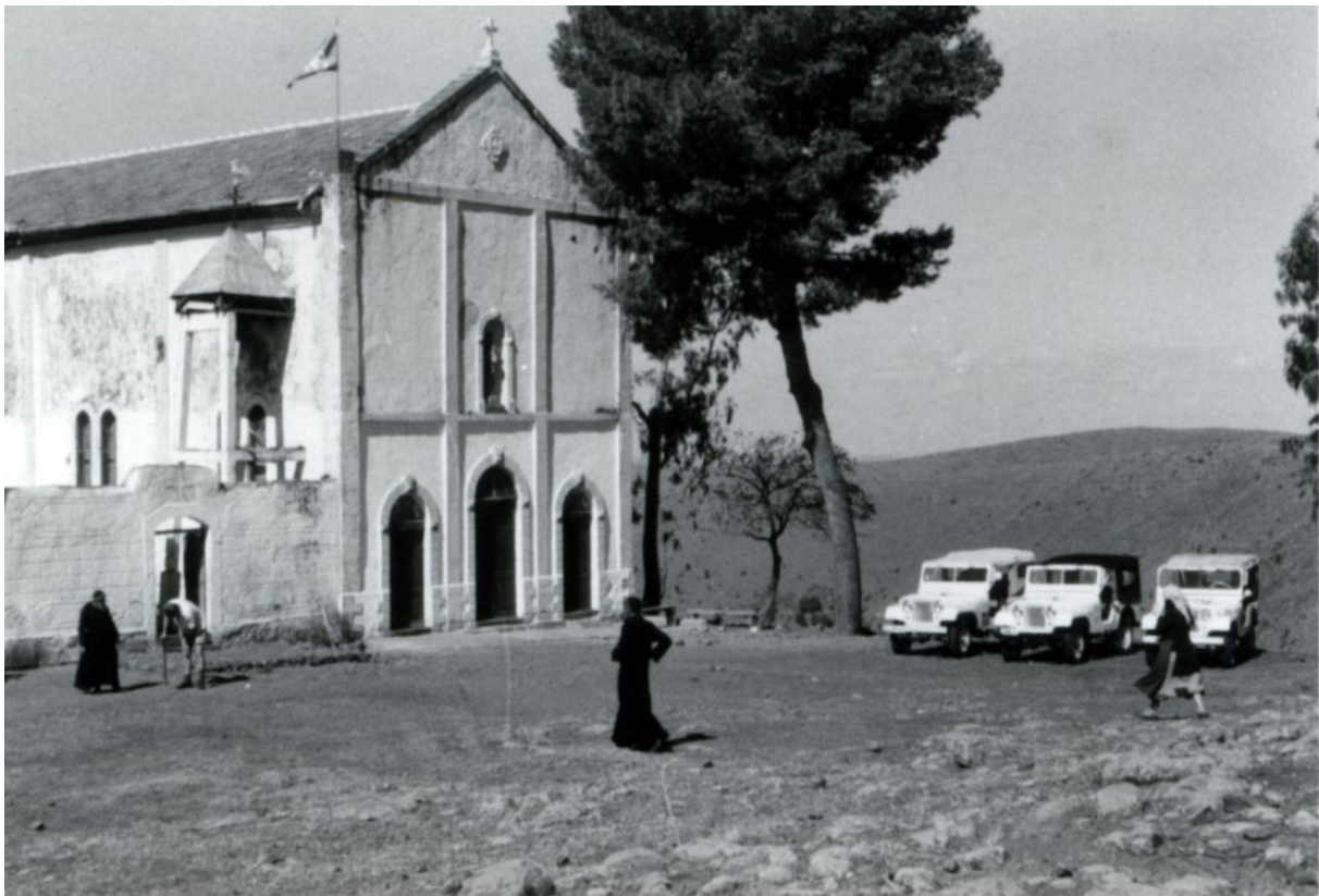
Bilete 4: Observasjonspost i nærleiken av Tripoli.

Likeins fortel Bull om møter med admiral Holloway og den amerikanske ambassadøren der utviklinga i Libanon vart diskutert. 393