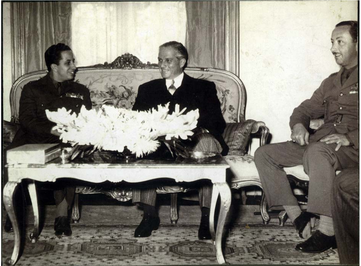
Bilete 1: Statsleiarar med gode relasjonar til vesten. Frå venstre: unge kong Feisel II av Irak og president Chamoun. 136