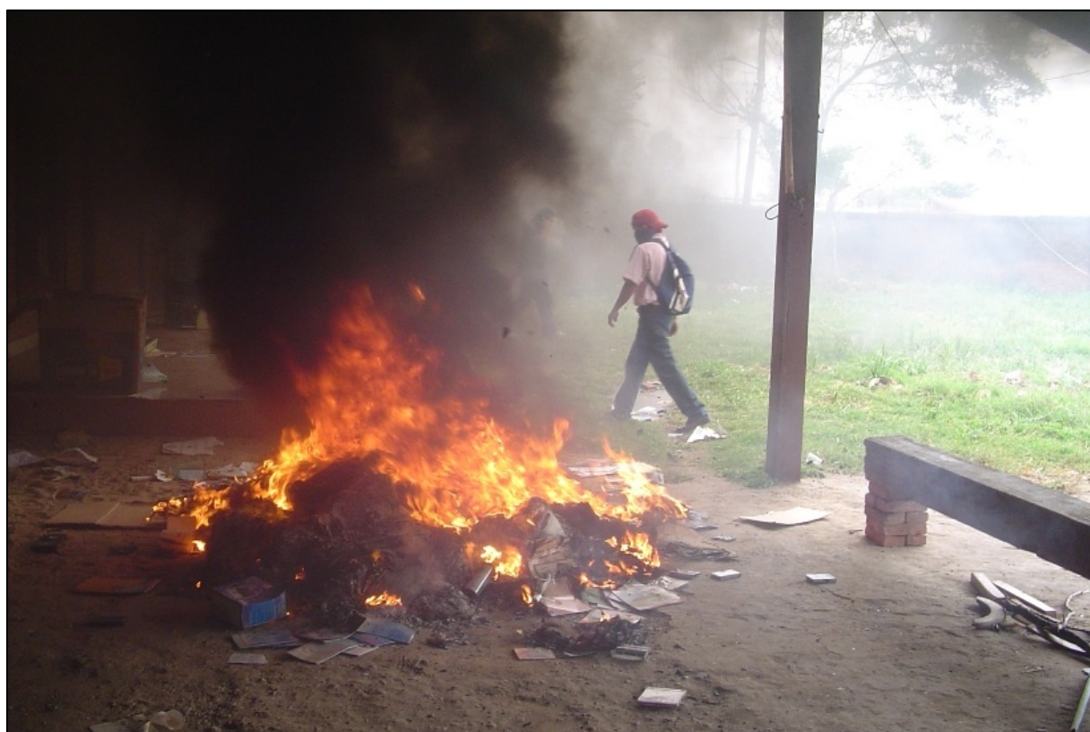
El Saqueo de CPESC 28

[...] si uno analiza todo el proceso de toma de instituciones, el primer intento de toma se da en el comando departamental de la policía que digamos es, es la presencia estatal de términos de fuerza más clara que hay en el departamento de Santa Cruz. Y luego se pasó [...] a la toma de las demás instituciones, primero la representación presidencial como cabeza digamos simbólica [...] y luego el resto de las instituciones, pero de allí jugaron obviamente intereses económicos MUY individuales y concretos puesto que hubieron quienes aportaron con recursos económicos para tomar tal institución equis sabiendo que él luego [...] iba a ser director de esta institución bajo de un régimen federal, cuasi federal o de, de república independiente en Santa Cruz. Entonces... O sea, el rol del Comité Cívico fue [...] de articular bajo la lógica de ser el Gobierno moral de los cruceños [...] una serie de acciones violentas, planificadas, de Golpe de estado (2B:92).