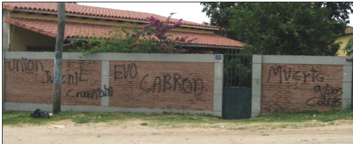
Pared en Santa Cruz de la Sierra.

(2006) argumenta que en el presente se está utilizando la imagen del migrante andino o colla como símbolo de la amenaza del Estado central.