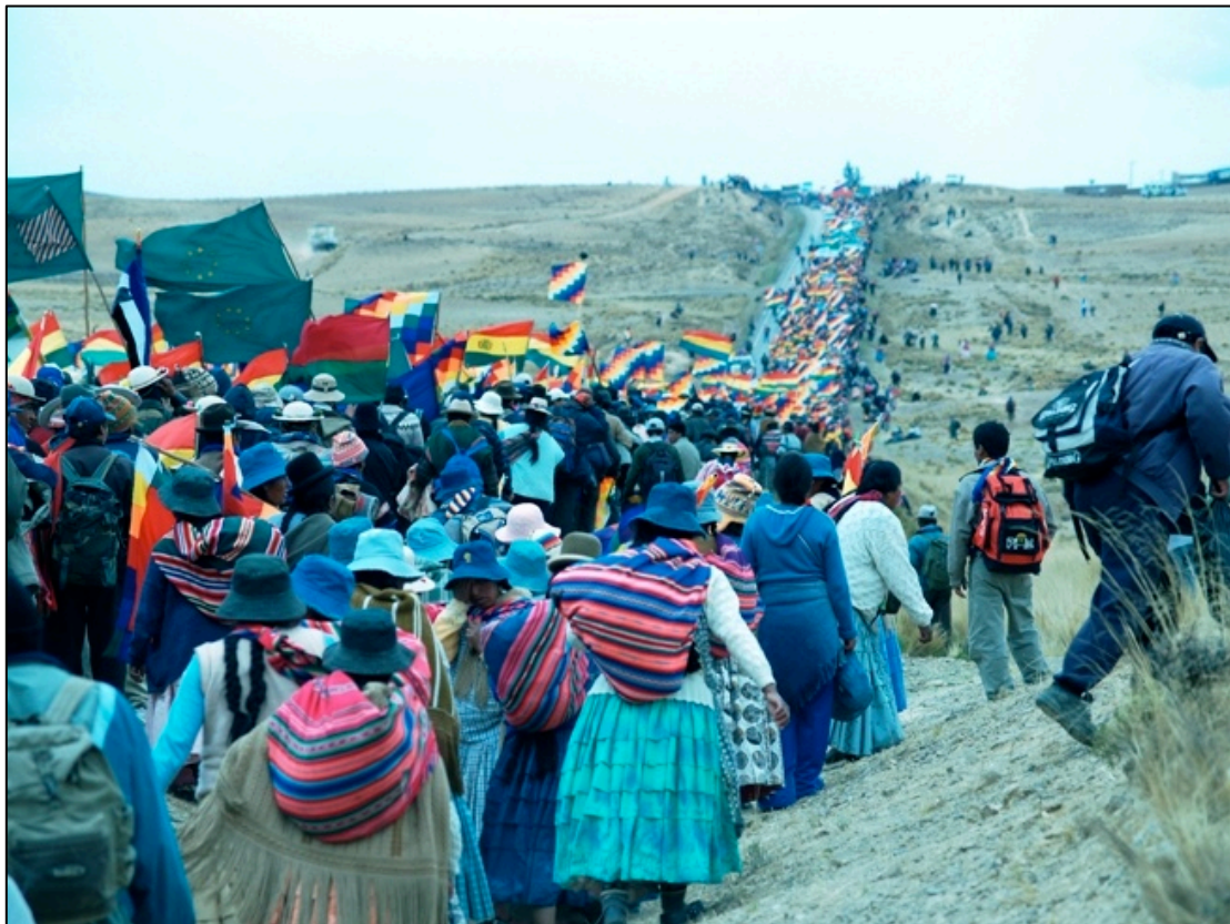
La Marcha hacia Plaza Murillo

En el diálogo las partes no llegan a un acuerdo, y el CONALDE deja en manos del Congreso Nacional las definiciones sobre la posible futura Constitución (Prado 2009). Cuando se inicia el debate en el Congreso a finales de octubre, una marcha campesina-indígena con miles de marchistas llegó a la Plaza Murillo después de haber atravesado más de 100 kilómetros en el altiplano, para vigilar el Congreso, y presionar a los congresistas de la oposición a aprobar una ley de convocatoria a un referéndum para legitimar el proyecto de Constitución (La Patria, 13/10/2008: P3.2) Según Mayorga (2009) los cercos al Congreso se convirtieron en un método de presión de los movimientos sociales afines al MAS para contrarrestar la capacidad de veto de la oposición parlamentaria en el Senado. La ley de referéndum se aprobó en el Congreso después de la modificación de más de 100 artículos en el proyecto de Constitución (El Diario, 21/10/2008: P3.2). El Gobierno cedió en varios de los artículos más radicales en la Constitución, y también se acordó compatibilizar la autonomía dentro del marco del texto constitucional.