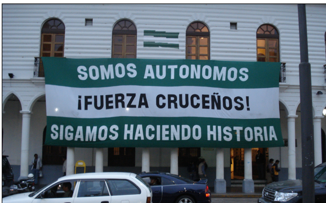
Bandera cruceña en la Plaza 24 de septiembre en Santa Cruz de la Sierra.

A partir de la crisis de octubre 2003 y la resultante quiebre de los partidos políticos tradicionales, el protagonismo político de oposición pasa entonces al CPSC y el movimiento